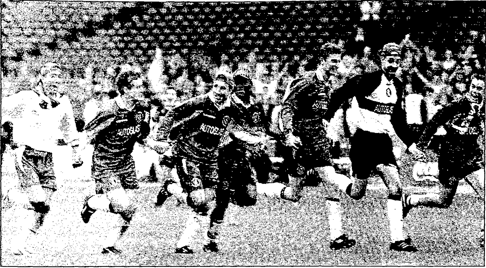
أعضاء فريق تشيلسي يهيمون من فرحتهم ويحيون الجمهور بعد فوزهم بالكأس

وفي المباراة النهائية التي أقيمت في القاهرة على استاد بورسعيد، تعادل المنتخب المصري المنتخب الاوغندي بنتيجة 1-1 في المباراة النهائية التي أقيمت في القاهرة على استاد بورسعيد.